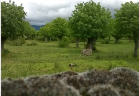
Fresnedas en el entorno de las Navas de Riofrío

laderas de esos pequeños oteros aparecen grandes losas de estas rocas. Grandes ejemplos de esto son las pequeñas elevaciones donde se encaraman la ermita de san Pedro de La Losa o la iglesia de este pueblo cuyo nombre viene de este topónimo tan geológico. En estas elevaciones sobre roca granítica también tenemos el paisaje berroqueño de grandes bolos, justo al salir de Ortigosa del Monte, entre las dos puertas que debemos cerrar al pasar.