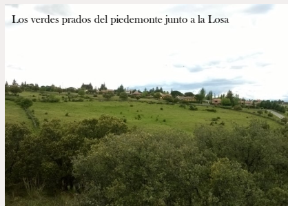
Los verdes prados del piedemonte junto a la Losa

Las rocas que componen el piedemonte son las mismas que las que componen la sierra, pero su pendiente es menor, lo que hace que el agua se acumule algo más en ellas, sobretodo en las zonas más bajas; las navas, navazos o lavajos. De ahí le viene el nombre a una de las localidades de nuestra ruta, las Navas de Riofrío. Estas zonas húmedas generan un paisaje fresco de bosque de fresnos, espinos y en ocasiones roble melojo o arce de Montpellier. Esta humedad genera suelos muy ricos en materia orgánica